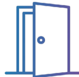
Sesiones de puertas abiertas