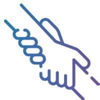
Línea de ayuda