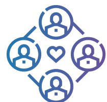
Communities of Support