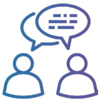
Servicios de consulta